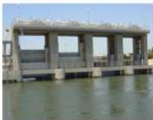
エジプト：灌漑施設の改修に係る調査・計画・設計・積算・施工管理