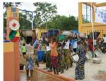
ベナン：女性が頭にタライを載せて運ぶ習慣に配慮した給水柱の設計