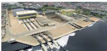
【水資源・治水分野】インドネシア国プレイット排水機場緊急改修計画

海外部門を担当する海外事業部には、現在およそ170名の社員が在籍しています。業務実績を有する国・地域は140を超えており、対象となる国や地域の開発課題に応じて、事業計画やプロジェクト評価、調査・設計、住民参加支援など幅広い業務を執行しております。