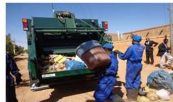
【廃棄物分野】スーダン国ハルツーム州廃棄物管理強化プロジェクト

* 中途採用は、当該分野でのコンサルタント実務経験（国内外不問）またはゼネコン、メーカー等での類似業務の経験がある方を歓迎します